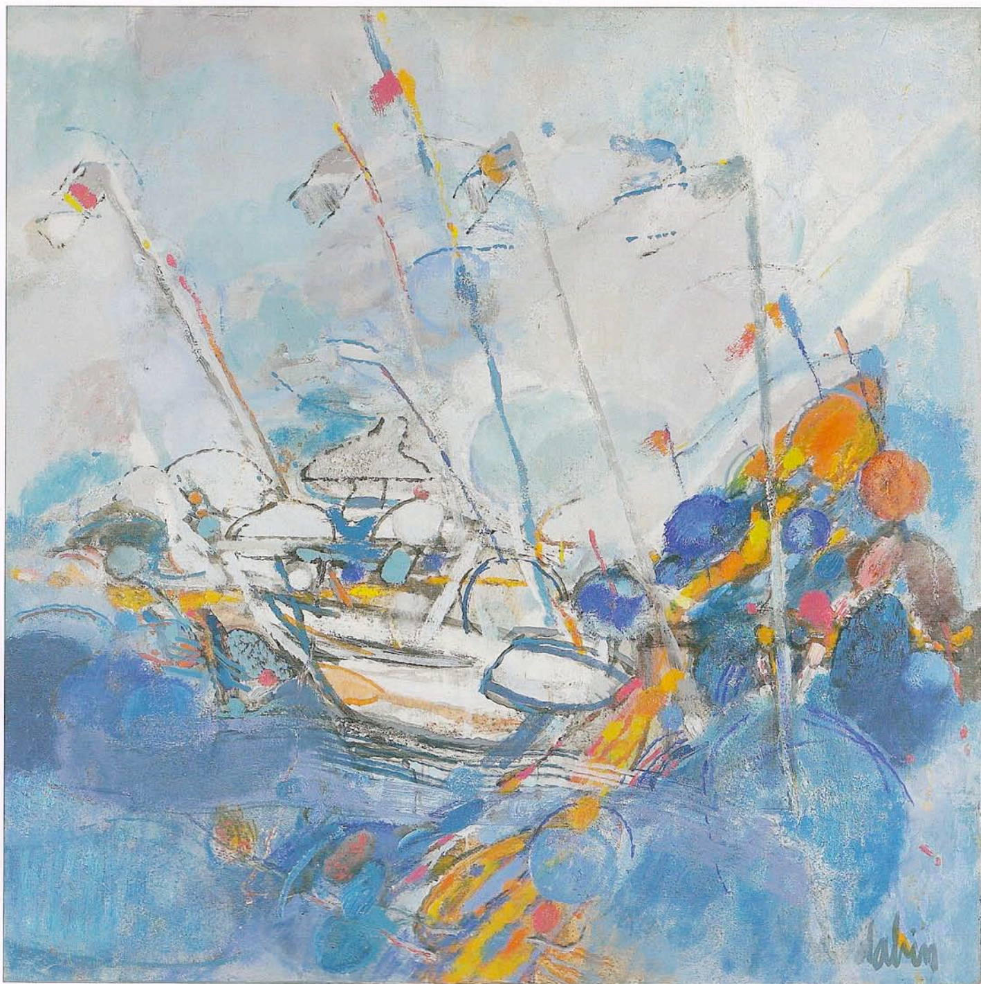
Les lamparos à Cadaques, huile sur toile, 100 x 100 cm

volumes. Et si parfois, on devine çà et là des réminiscences classiques qui nous ramènent vers Velasquez, elles s'évanouissent rapidement dans un tourbillon d'énergies qui entraîne notre esprit vers des contrées sauvages de tous les possibles. C'est d'ailleurs avec la même frénésie que ce peintre enthousiaste a pu, en son temps, réinventer le Don Quichotte de Cervantes, les taureaux de Séville et les grands voiliers de Bretagne, liant tous ces thèmes en une même ligne d'éternité.