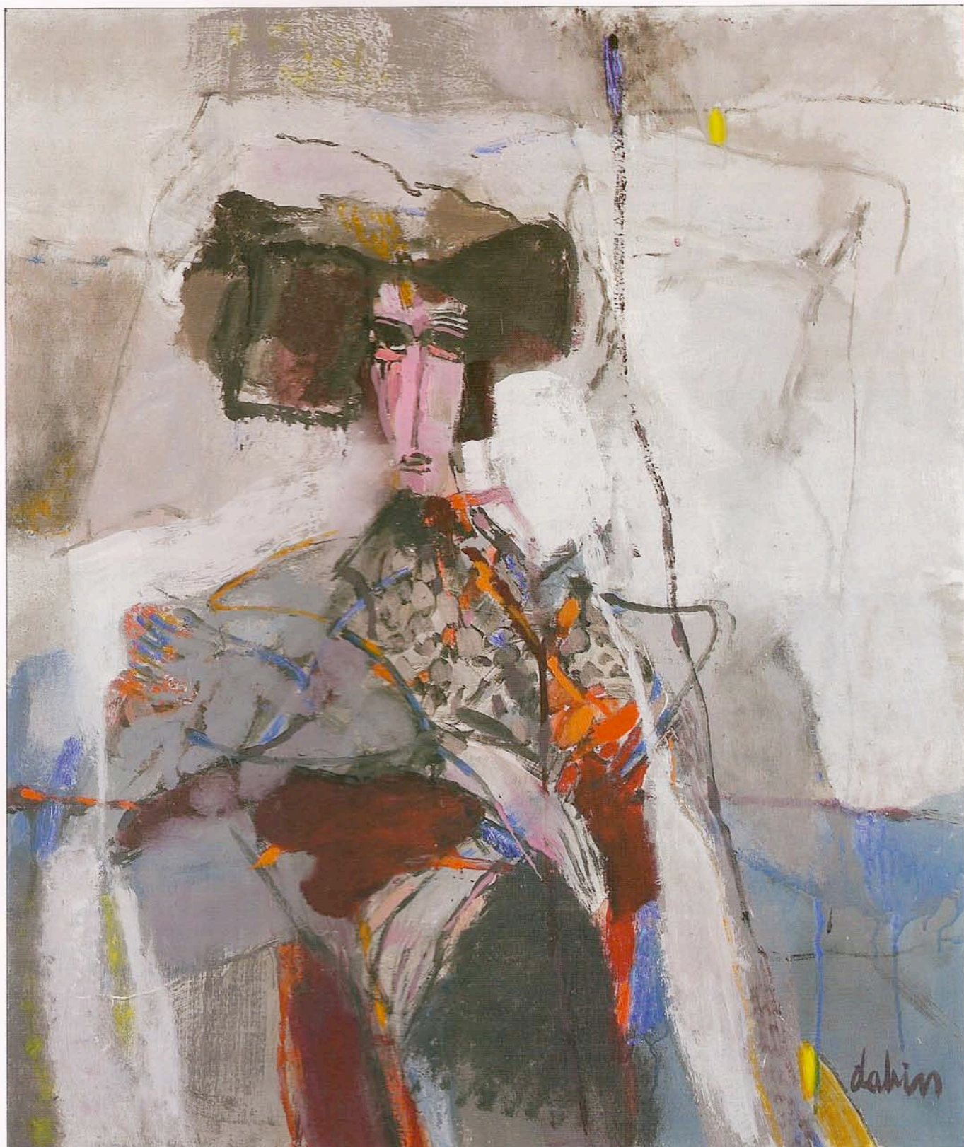
"Escamillo", huile sur toile, 100 x 81 cm