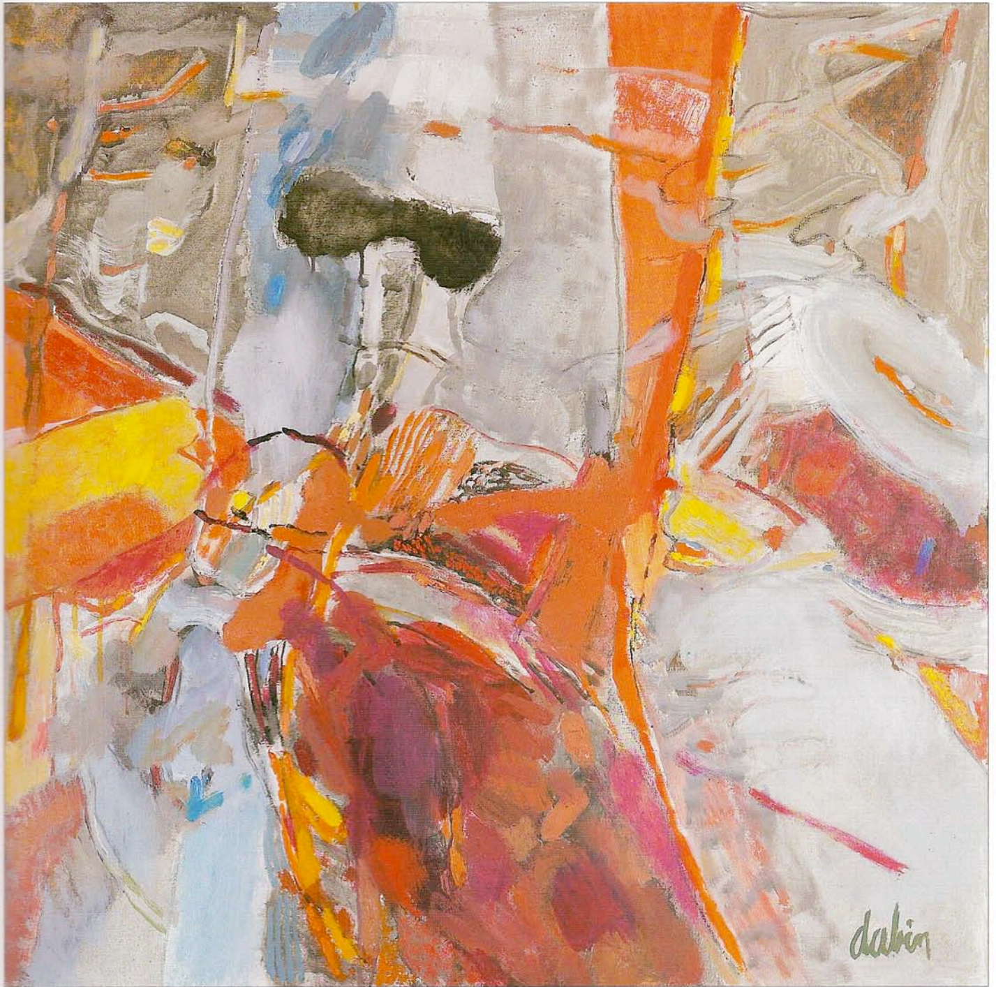
"Don Quichotte", huile sur toile, 100 x 100 cm