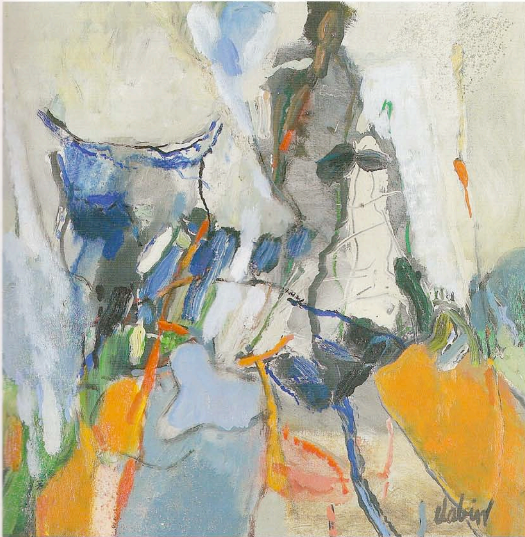
"Elevage de taureaux", huile sur toile, 50 x 50 cm

artistique qui l'entraîne à poursuivre sa route pour découvrir encore et encore les zones interdites de l'âme humaine.