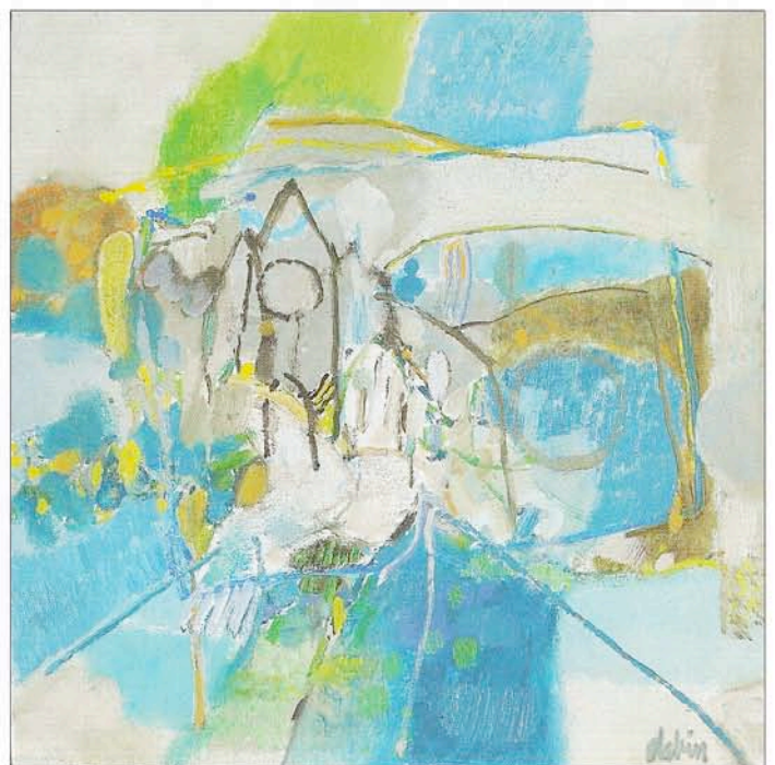
"La basilique romane", huile sur toile, 60 x 60 cm