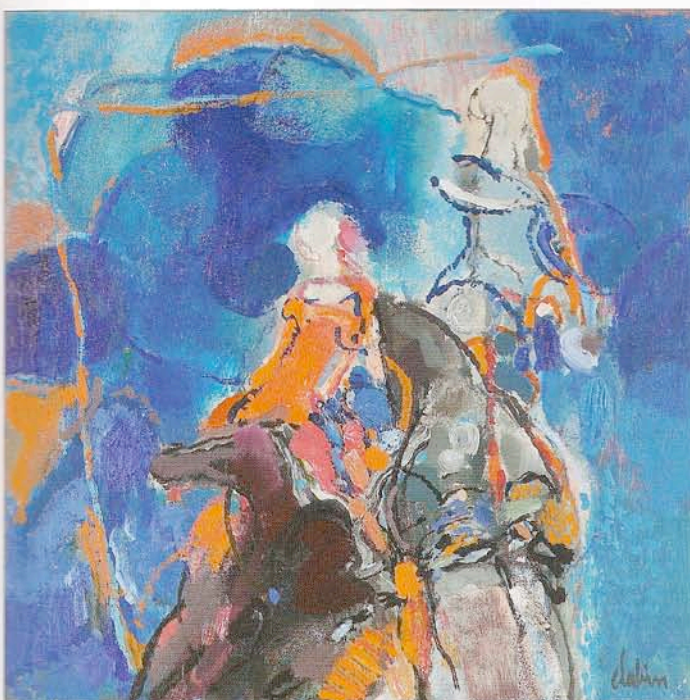
"Les andalouses à Malaga", huile sur toile, 50 x 50 cm